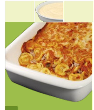
Tortelloni-Gratin "Tomate" G, G1, Ei, M, Me, La Karottensalat Spezial 3 Pfirsich Maracujajoghurt M, Me, La 2