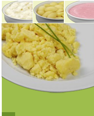
Rührei Ei, M, Me, La Blumenkohl in holländischer Soße G, G1, M, Me, La, S Salzkartoffeln Kirschjoghurt M, Me, La 2