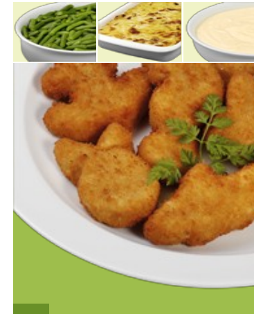
Bunte Meereswelt geformte Portionen aus Alaska-Seelachs (aus nachhaltiger Fischwirtschaft) paniert G, G1, Fi Grüne Bohnen "naturell" Kartoffelgratin G, G1, M, Me, La, S Quark Vanille M, Me, La 1