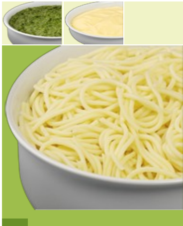
Spaghetti aus Hartweizengrieß G, G1 Rahmspinat M, Me, La H-Pudding Vanille M, Me, La